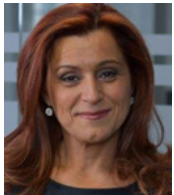
Me Gabrielle Azran Azran & associés avocats Montréal