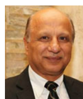
Léo Ziadé Invest Gain Montréal