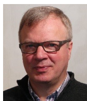
Jean-François Lavigne Zararé + Lavigne Architectes inc. Provincial