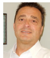
André Grenier Centre d'Inspection du Québec Provincial